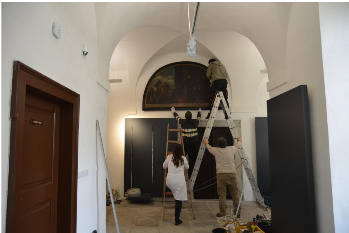
Ze stavby nové expozice historie