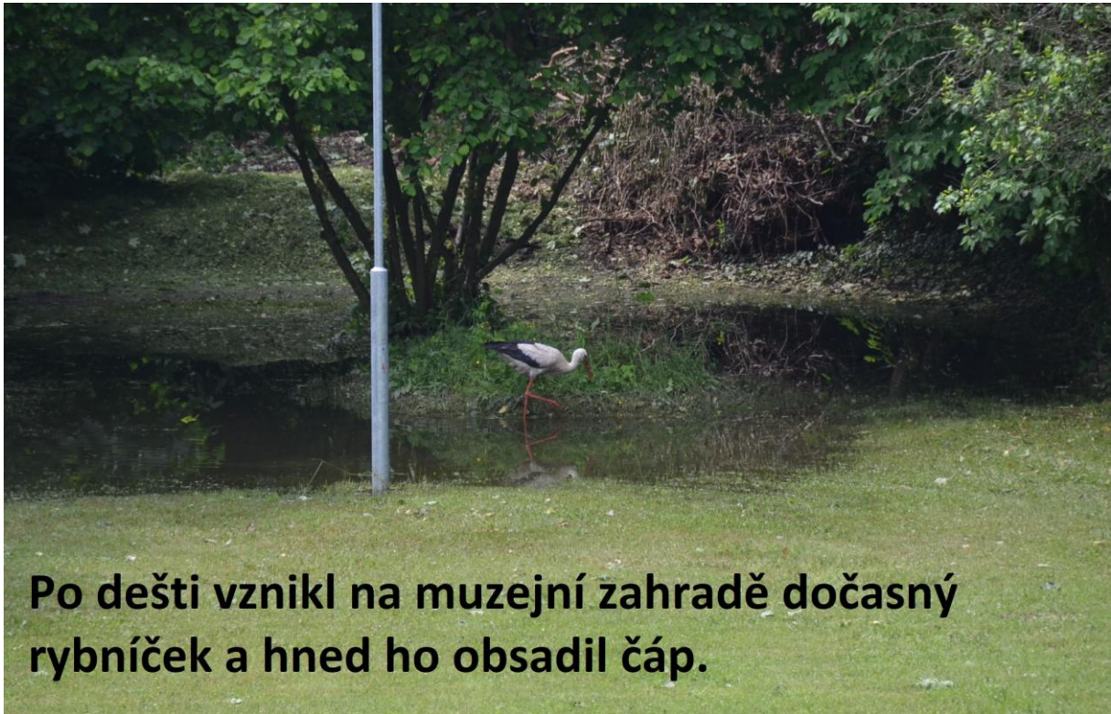
Po dešti vznikl na muzejní zahradě dočasný rybníček a hned ho obsadil čáp.