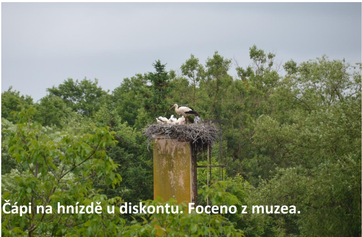
Čápi na hnízdě u diskontu. Foceno z muzea.